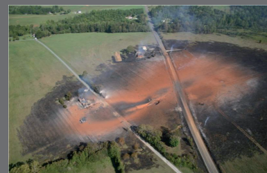
Conséquences d'une fuite sur une canalisation de transport, Appomatox (USA), 14 septembre 2008.